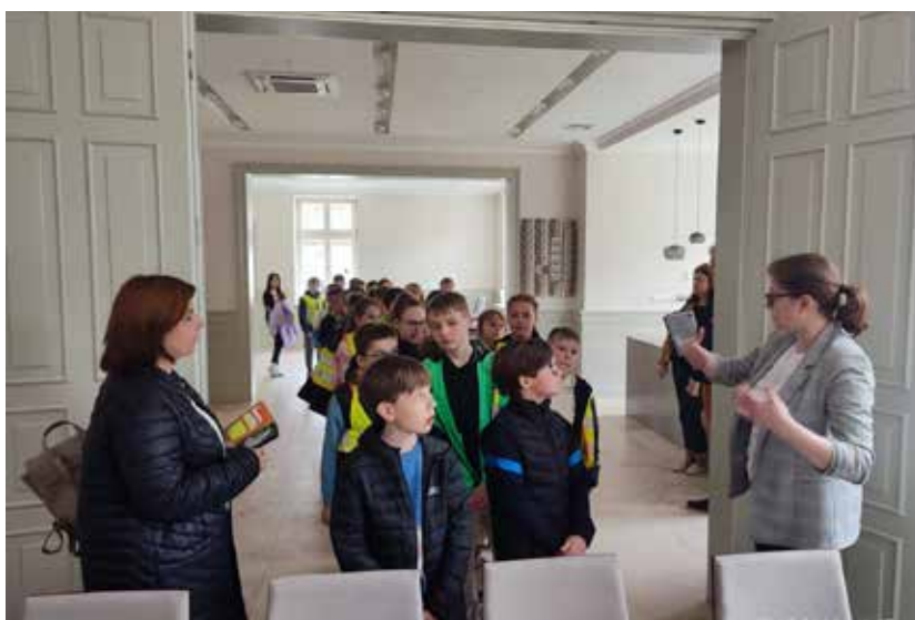
Dni Otwarte willi przy ul. Mickiewicza – filia BPMiG w Dębnie