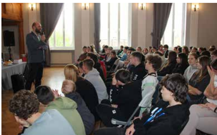
Uczniowie Szkoły Podstawowej nr 3

wolny czas na czytaniu, chociaż parę minut dziennie. Młodzież z uwagą słuchała wyjątkowo pozytywnego gościa.