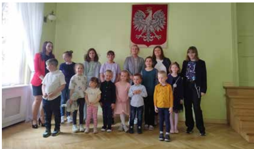
Laureaci II edycji „Czytelnik Roku 2022” – czytelnicy najmłodszy