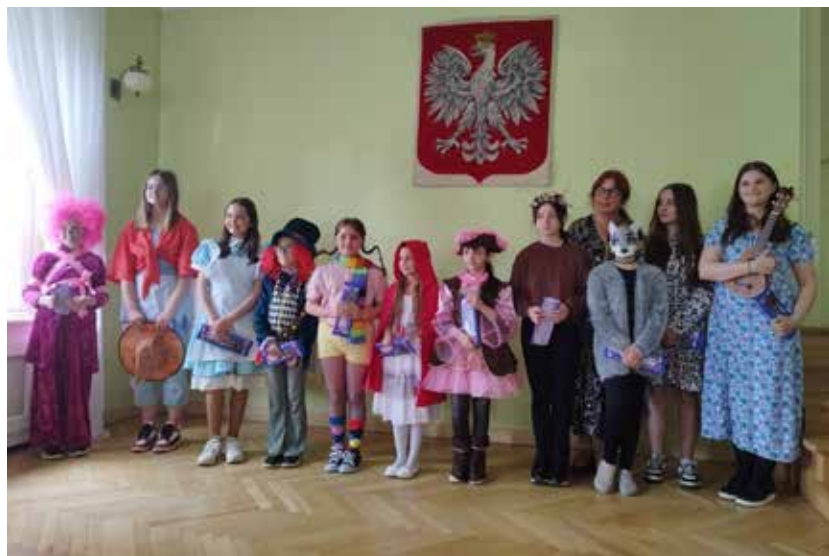
Występ grupy uczniów z SP nr 1 pt. „Alicja i przyjaciele zapraszają do magicznego świata czytania”