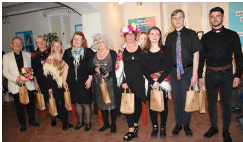
Przedstawienie pt. „Portret kobiety” – mistrzyni Szymborska

zostali wytypowani na podstawie największej liczby przeczytanych książek w następujących kategoriach: