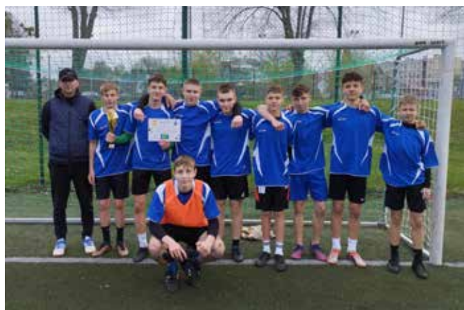
Drużyna z SP 1 Dębno