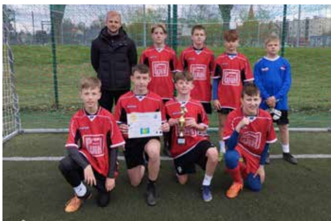
Drużyna z SP 3 Dębno