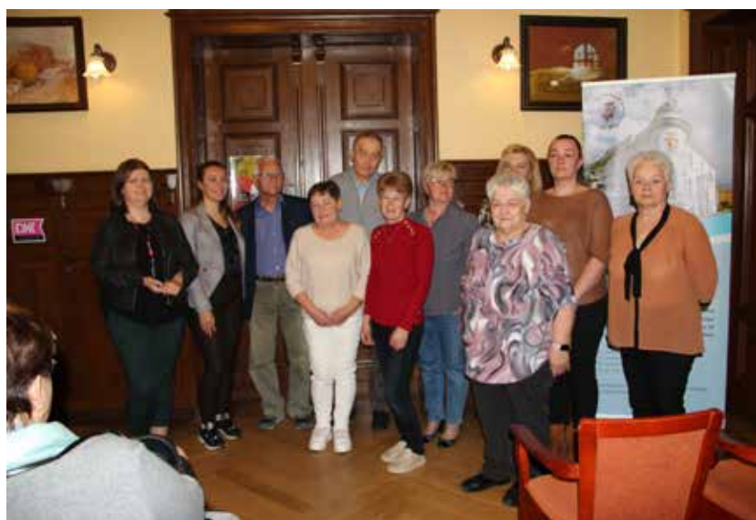
Laureaci II edycji „Czytelnik Roku 2022” – czytelnicy dorośli