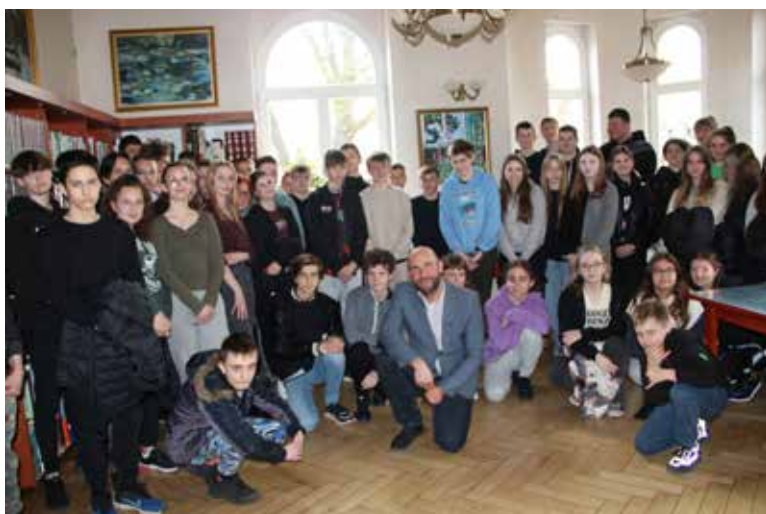
Uczniowie Szkoły Podstawowej nr 1