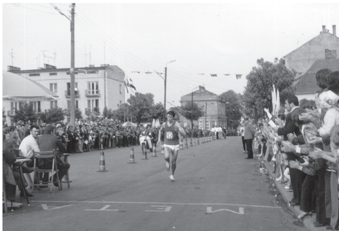
1976 r. - Leonid Mosiejew.