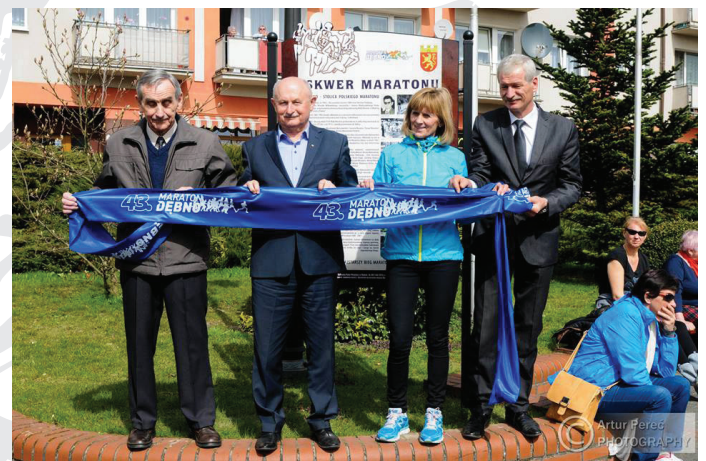
2016 r. - Odstonięcie Skweru Maratonu.