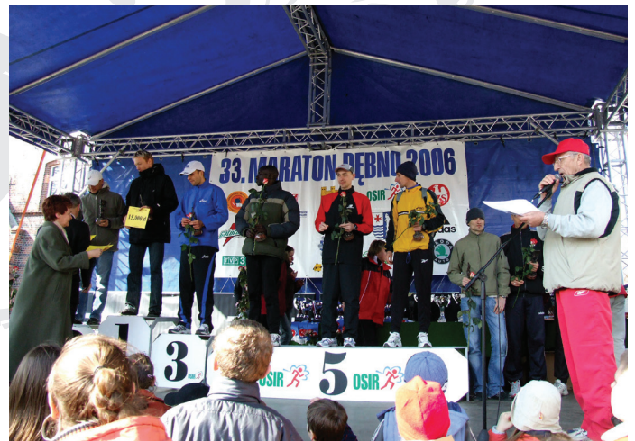
2006 r. - Zwycięzca maratonu.