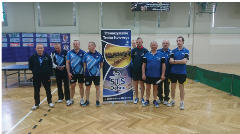
Tabela po 8 terminie, IV liga 2017/2018.