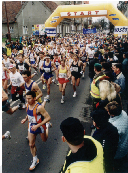
2001 r. - Zawodnicy minęli linię startu.