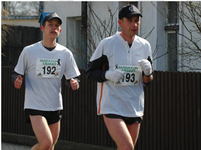
2005 r. - Zawodnicy na trasie - wstążeczki.

W związku z żałobą narodową, ogłoszoną po śmierci papieża Jana Pawła II, organizatorzy maratonu odwołali wszystkie zaplanowane imprezy artystyczne, w czasie biegu zawodnicy mieli przypięte do koszulek czarne kokardki na znak pamięci o Wielkim Polaku.