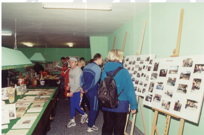
2001 r. - Wystawa.

28. Międzynarodowy Bieg Maratoński ponownie pod patronatem Prezydenta RP i w randze Mistrzostw Polski w Maratonie Mężczyzn i Mistrzostw Polski w Maratonie Kobiet .