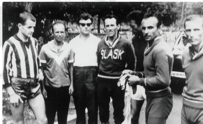
1967 r. - Grupa zawodników przed startem do II małego maratonu.

Pierwsza edycja nowej sportowej imprezy, którą nazwano - Mały Maraton „O Błękitną Wstęgę Granicy Pokoju”, odbyła się 22 lipca 1966 roku na trasie z Cedyni do Siekierki.