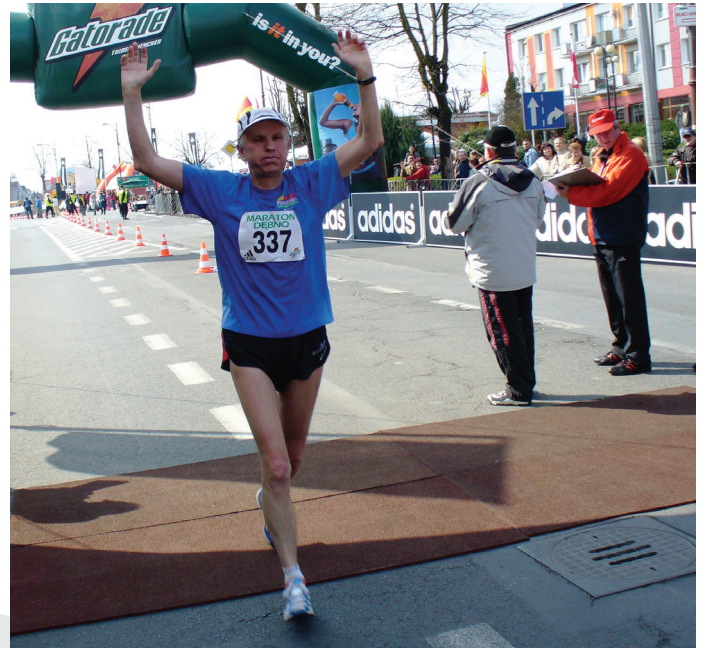
2008 r. - Minister Grzegorz Kołodko na mecie.

Z okazji 35. jubileuszowego maratonu Poczta Polska wydała okolicznościową kartkę pocztową ze specjalnym datownikiem.