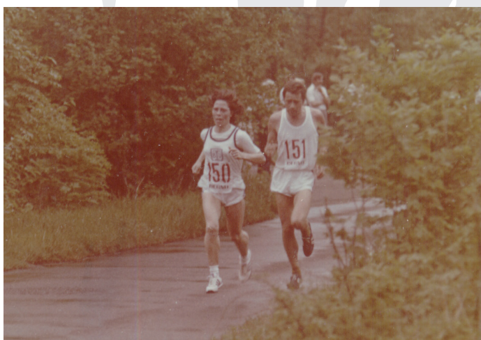
1979 r. - Christa Vahlensieck.

Na starcie obok 102 mężczyzn stanęła Christa Vahlensieck (RFN) - pierwsza kobieta w dziejach dębnowskiego maratonu, która ukończyła bieg w czasie 2:41:57. Zawodniczka była jedną z pionierek biegów maratońskich, w 1977 roku pobiła rekord świata z czasem 2:34:48, w latach 1973 - 89, zwyciężała w 21 maratonach (m.in. w Berlinie, Wiedniu, 5-krotnie w Koszycach).