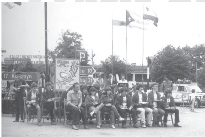
1981 r. - Sędziowie notujący okrążenia.

Jeden z internautów napisał króciutko: „A właśnie tu maratonem żyją wszyscy, od burmistrza do księdza modlącego się w naszej intencji.”