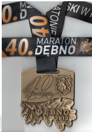
2013 r. - Medal.