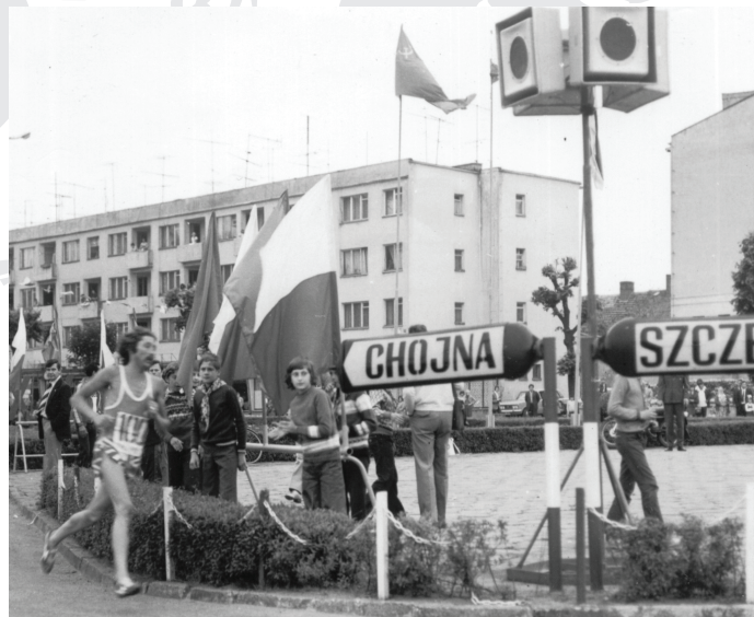
1975 r. - Ron Hill.

Po raz pierwszy bieg ukończyło ponad stu zawodników (119 na 138 startujących).