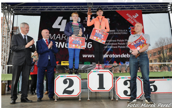
2016 r. - Dekoracja zwycięzców.

Do roku 1987 kolejne edycje zawodów maratońskich numerowano cyframi rzymskimi (np. XV Międzynarodowy Maraton i Mistrzostwa Polski w Maratonie), a od roku 1988 zaczęto stosować numerację z użyciem cyfr arabskich - np. 40. Maraton Dębno).