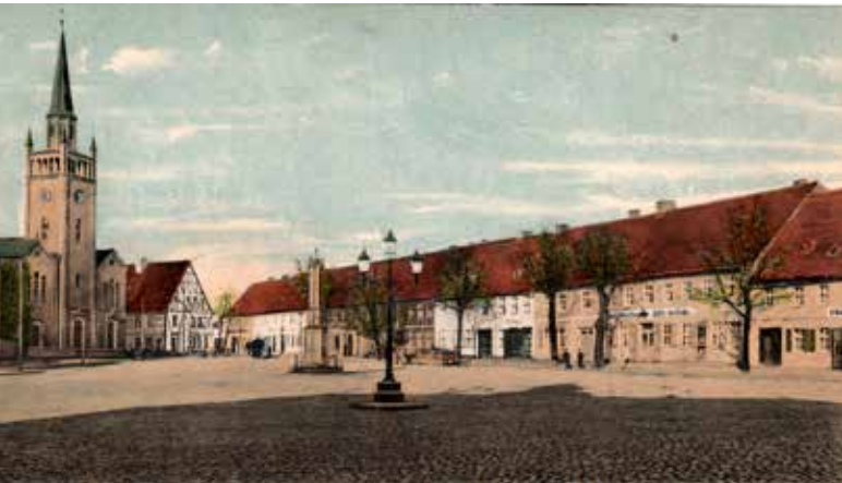
Skan widokówki z ok. 1903 r. Rynek z kościołem oraz Budynek Zarządu Domy Margrabiowskiej. Poczłtówka bez obiegu pocztowego. Wykonana techniką światłodruk kolorowy. Nieco przeretuszowane kontury