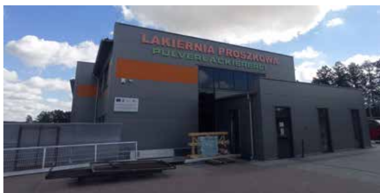
Metallbau – Cychry