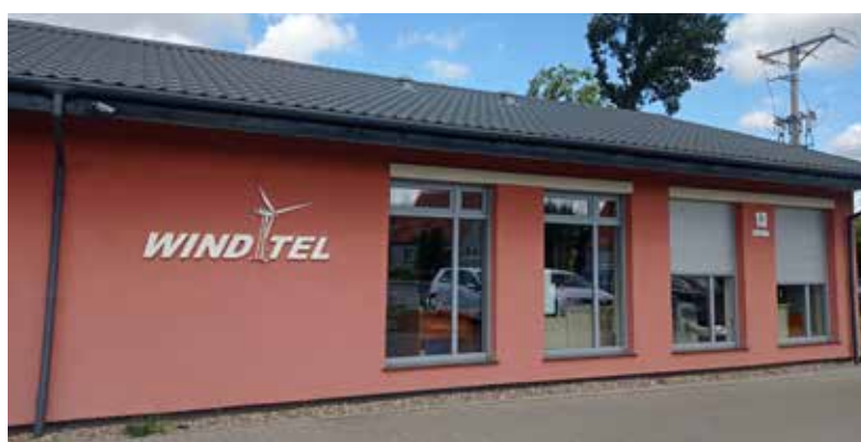
Windtel – Dębno