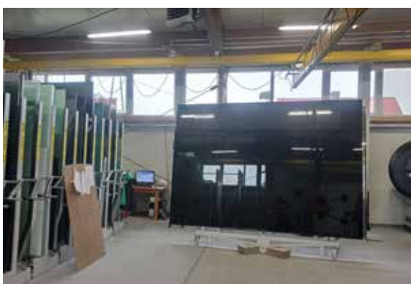
Wolfglas – Grzymiradz