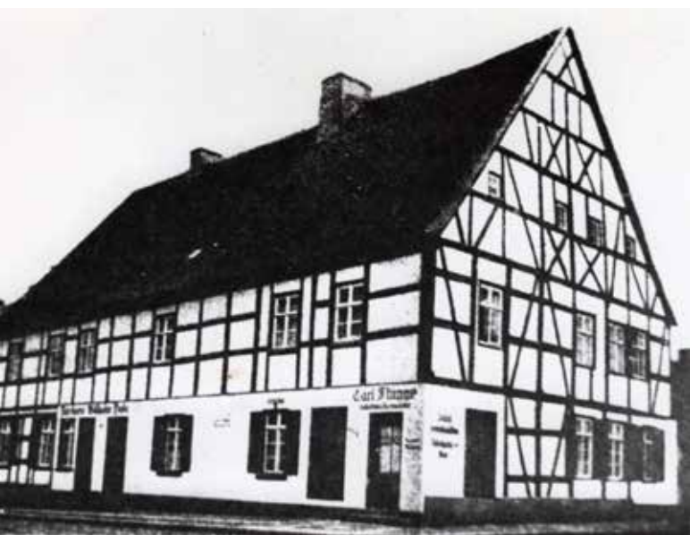
Budynek Zarządu Domy Margrabiowskiej z XVI w.