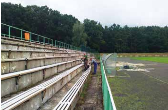
Trybuny przed remontem