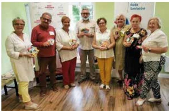
Warsztaty w dniach 12 i 13 lipca br.