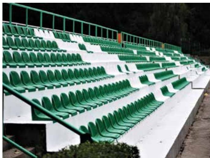
Trybuny po remoncie