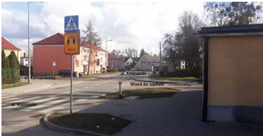
Stan obecny na skrzyżowaniu