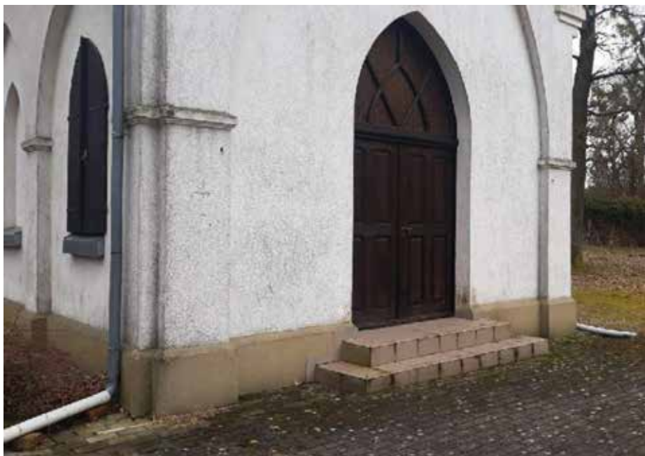
Kaplica w Dolsku