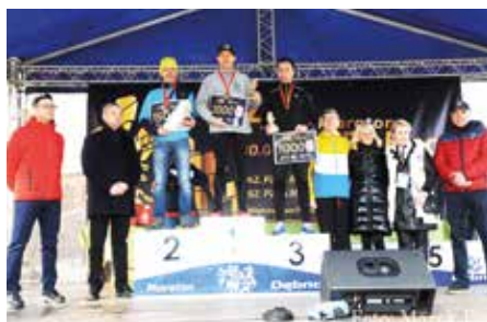
Zwycięzcy Mistrzostw Polski Nauczycieli