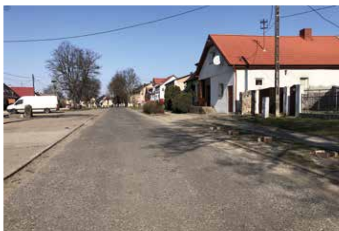
Droga w Różańsku