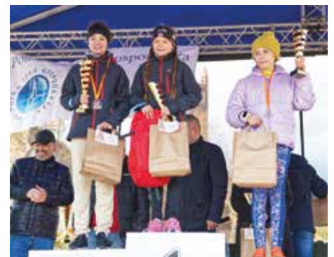
V Bieg 600 m dziewcząt - rocznik 2010