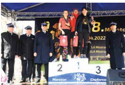
Zwycięzynie Mistrzostw Polski Strażaków