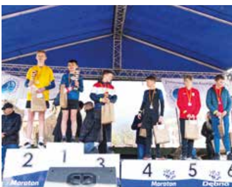
VIII Bieg 600 m chłopców - rocznik 2009