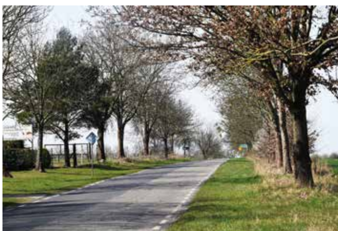
Droga powiatowa w kierunku Boleszkowic

Dbając o bezpieczeństwo i jakość życia mieszkańców miasta i gminy Dębno, Rada Miejska Dębna i burmistrz Dębna systematycznie podejmują decyzję o wsparciu inwestycji powiatowych. W 2021 roku z budżetu gminy Dębno przekazano 300 tys. złotych zgodnie z zestawieniem w poniższej tabeli. Ostatecznie wykorzystano 230 tys. złotych.