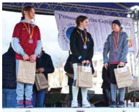
V Bieg 600 m dziewcząt - rocznik 2010