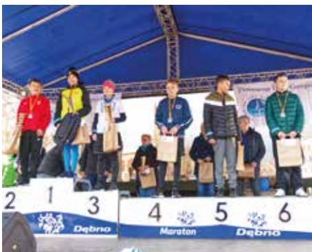
V Bieg 600 m chłopcy - rocznik 2010