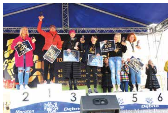
Zwyciężczynie Mistrzostw Miasta i Gminy Dębno