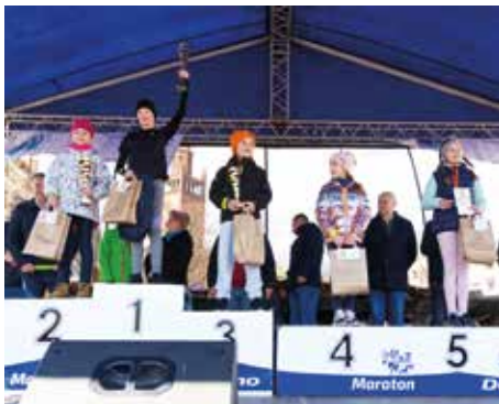
I Bieg 400 m dziewcząt - rocznik 2012 i młodsze