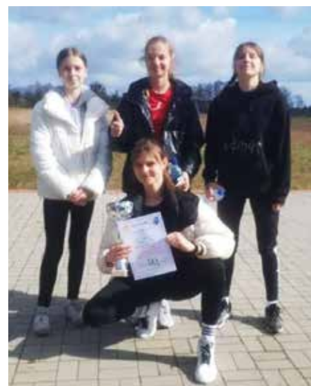
Uczennice z SP 3 Dębno

Do finału wojewódzkiego zakwalifikował się zespół Szkoły Podstawowej nr 4 w Barlinku.