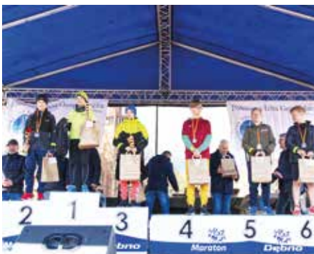
IV Bieg 400 m chłopców - rocznik 2011