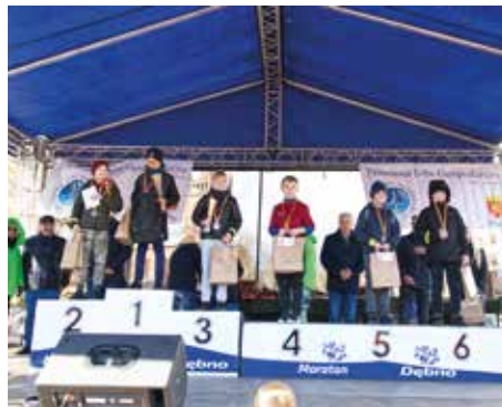
II Bieg 400 m chłopców - rocznik 2012 i młodsze