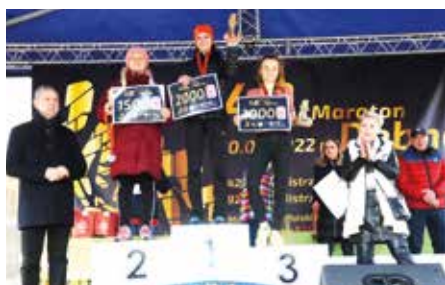
Zwycięzynie Mistrzostw Polski Nauczycieli