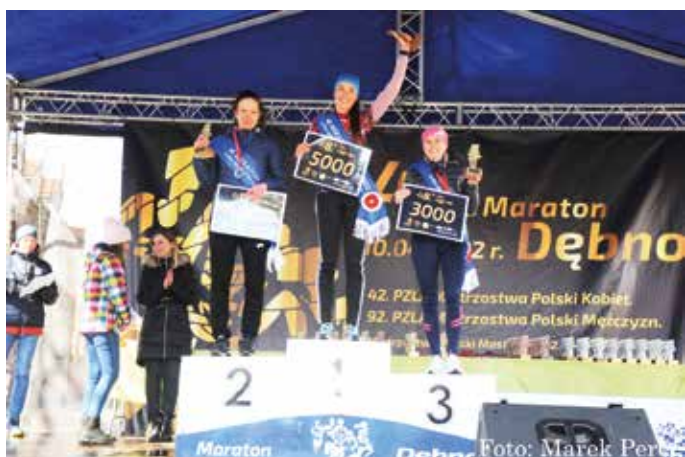
Mistrzyni Polski w 48. Maratonie Dębno