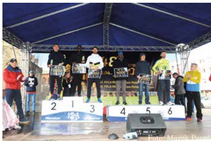
Zwycięcy 48. Maratonu Dębno