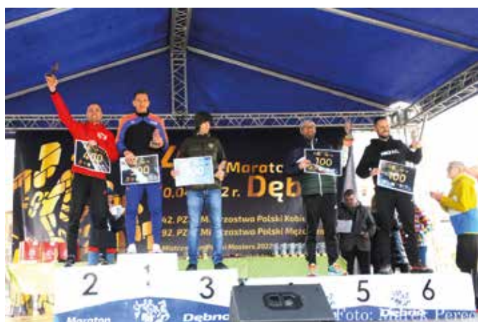
Zwycięcy Mistrzostw Miasta i Gminy Dębno