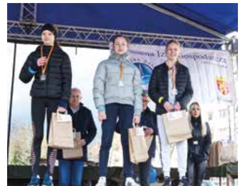
VII Bieg 600 m chłopców - rocznik 2009