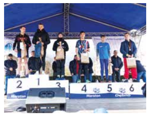
X Bieg 800 m chłopców - rocznik 2008-2007