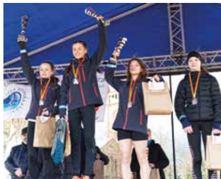
VII Bieg 600 m dziewcząt - rocznik 2009