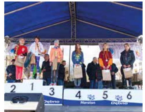
III Bieg 400 m dziewcząt - rocznik 2011