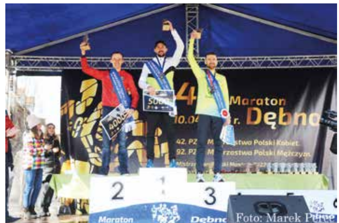
Mistrzowie Polski w 48. Maratonie Dębno